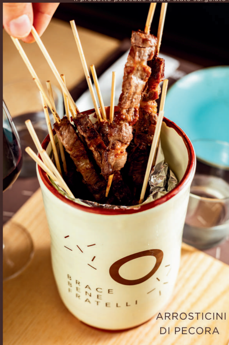
ARROSTICINI DI PECORA

*Il prodotto potrebbe essere stato surgelato all'origine