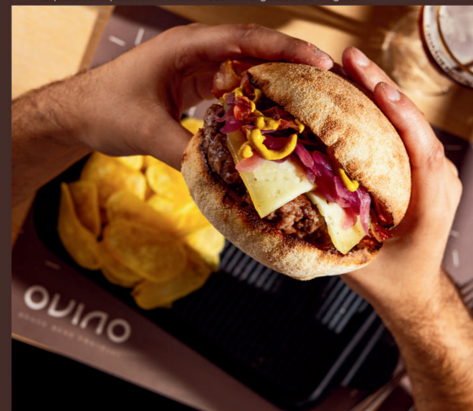
COPERTO E SERVIZIO

*Il prodotto potrebbe essere stato surgelato all'origine