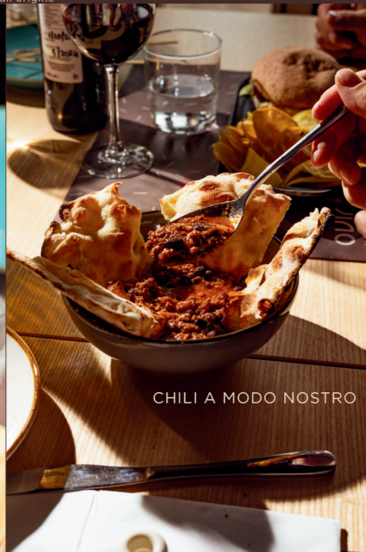
CHILI A MODO NOSTRO

PUGLIESE Carne di manzo, il nostro pane, burrata intera, bacon, rucola (glutine, latticini e soia)